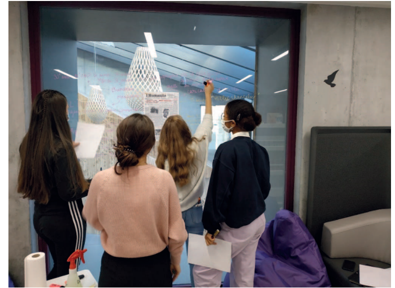
Un climat de travail serein